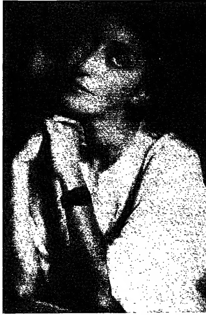
من مهرجان البندقية السينمائي جائزة افضل ممثلة للعام ١٩٨٤ للفنانة باسكال اوجيه على دورها في فيلم الالبالي المقمرة للمخرج اريك رومر وقد تصدرت صورها الصفحات الاولى في الجرائد العالمية والمجلات الفنية.